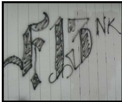
Hình vẽ/chữ viết trên tường của băng đẳng được dùng để khẳng định lãnh thổ, và giao tiếp với các băng đẳng kình địch. Mẫu đinh/dán F13 này trong kiểu mẫu tự Tiếng Anh Cổ, và khẳng định lãnh thổ cho băng đẳng Florencia, và NK là một sự đe dọa tới băng đẳng kình địch Norteños.

Nhạc rap “Gangsta” là một kiểu âm nhạc dùng các ca khúc trữ tình để tô son điểm phấn cho cuộc sống và sự bạo động của băng đẳng. Nhạc rap có thể tô điểm cho một băng đẳng cụ thể nào đó, và cũng có thể lãng mạn tới các băng đẳng khác, tới cảnh sát, và các nhóm khác.